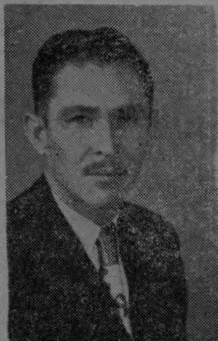
...donar un poco de sangre.